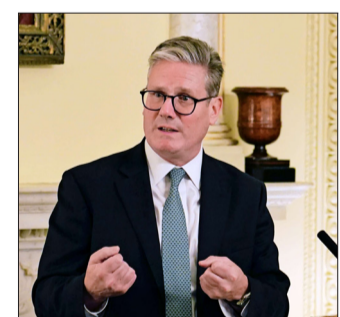
KEIR STARMER asumió como Primer Ministro británico en julio.

A nivel internacional, en tanto, el Presidente estadounidense, Joe Biden, consideró que una solución diplomática de ese conflicto es “factible”, declaró el portavoz de la Casa Blanca, Karine Jean-Pierre, mientras que la Guardia Revolucionaria iraní, aliada a Hezbollah, prometió una dura respuesta a Israel por ataques en Líbano.