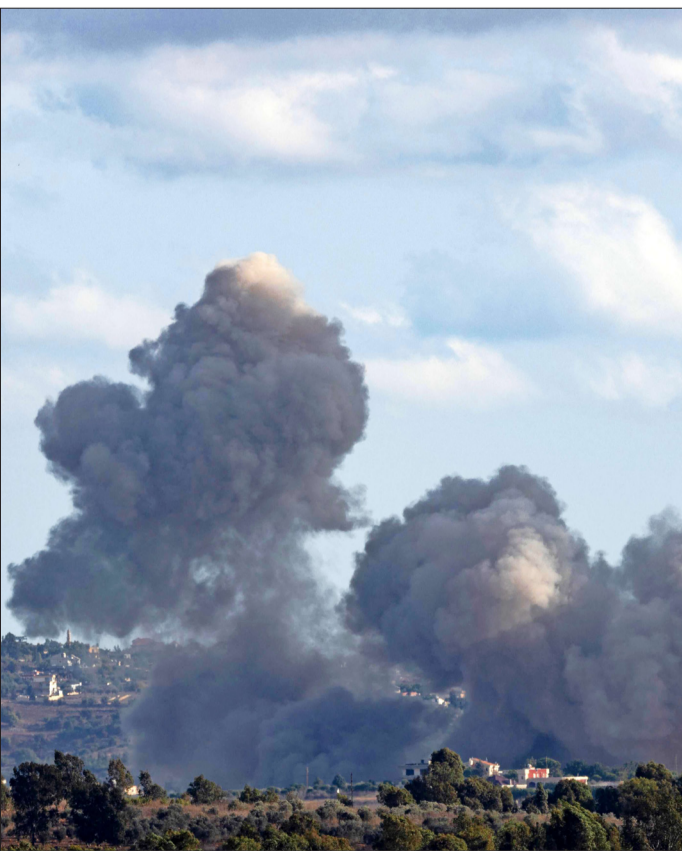
LOS BOMBARDEOS israelíes se concentraron en el sur de Líbano.

Según informó el canal local de televisión Al Manar, perteneciente a Hezbollah, en concreto, cazas israelíes lanzaron más de medio centenar de bombardeos contra varias zonas. “El número de bombardeos aéreos realizados por el enemigo aumenta a 52 contra las zonas de Al Hargiya en Al Mahmudeya, el extrarradio de Al Aishiya, los Altos de Rihan y los alrededores de