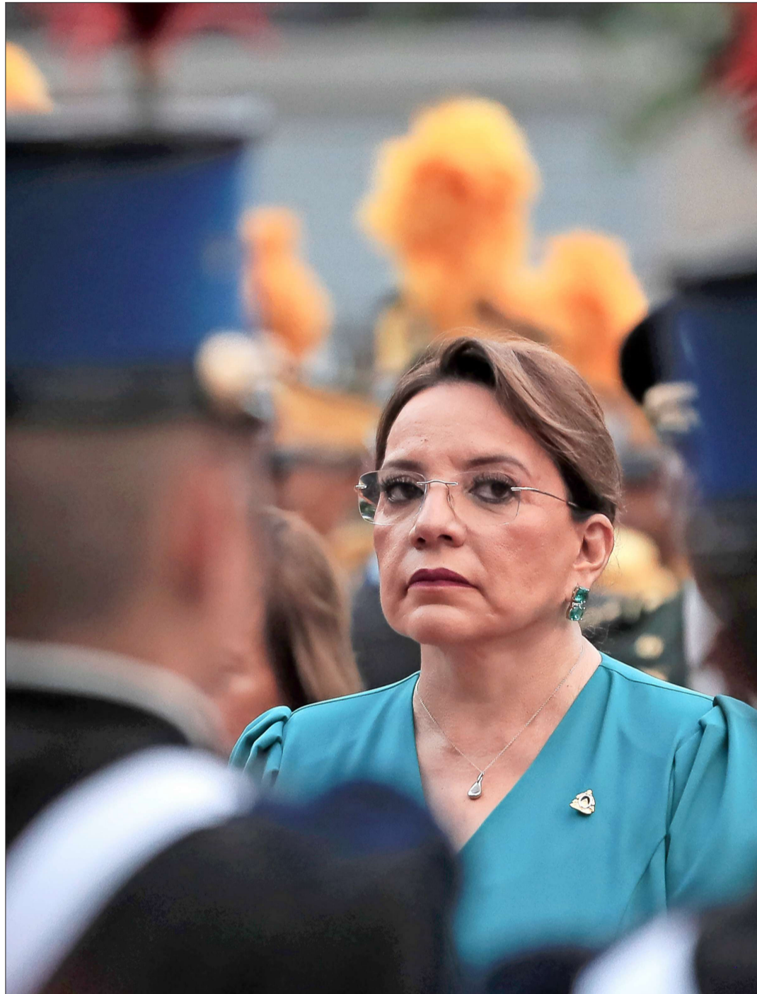
CASTRO, en el poder desde 2022, denunció que es víctima de un supuesto complot.

“La embajadora nada más dio su opinión, se podría solucionar con una nota diplomática o una audiencia, pero de inmediato el gobierno de Castro se enfocó en anular el tratado de extradición, acusando que era una ‘injerencia’. Son puros pretextos, excusas. Está tratando de proteger a familiares”, comentó a “El Mercurio” Mike Vigil, jefe de operaciones de la agencia antidrogas de Estados Unidos (DEA), quien